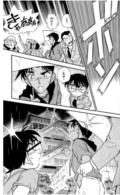
▲大阪ダブルミステリー

◆期間：2020年10月26日（月）12：00～ 2021年1月12日（火）23：59