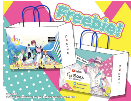
▲サイバードショッパー(イメージ)