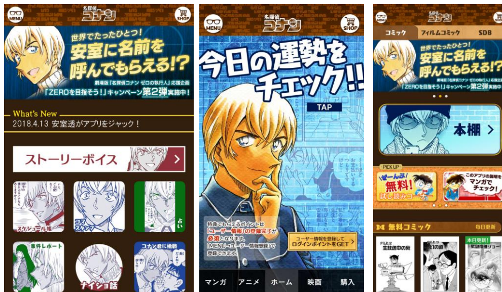
▲本アプリの「安室透」デザインバージョン

今回実施する「ZEROを目指そう！」キャンペーン第2弾では、本アプリ内3ヶ所にある「ZERO ボタン」を押して、「2,200,000」のカウントを“ZERO”にする企画です。“カウント 0”到達で、世界でたったひとつ、安室に名前を呼んでもらえるボイスを、抽選で3名様にプレゼントします。また、「ZEROを目指そう！」キャンペーン第2弾開始の本日より、本アプリが「安室透」にジャックされ、デザインが「安室透」一色となっています。