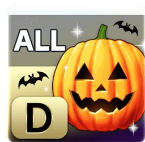
▲「ハロウィンコーチ」各種

●期間（日本時間）：2016年10月25日（火）19:00 ～11月1日（火）14:59