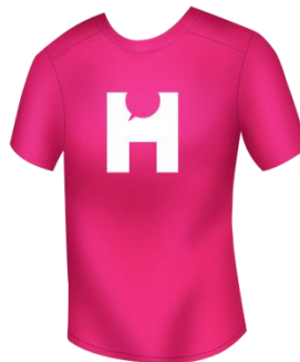
▲「HIKAKIN オリジナルシャツ」各種