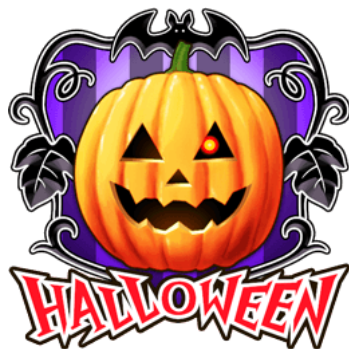
▲「ハロウィンエンブレム」