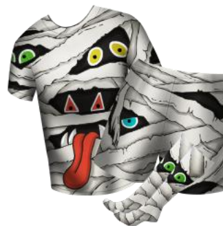
▲「ハロウィンユニフォーム」