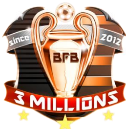
▲300万ダウンロード 記念エンブレム(銅)