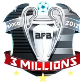
▲300万ダウンロード 記念エンブレム(銀)