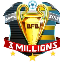
▲300万ダウンロード記念エンブレム