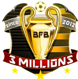
▲300万ダウンロード 記念エンブレム(金)