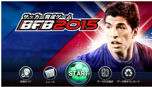
▲『ルイス・スアレス』選手 バージョンタイトル画像