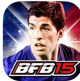
▲『ルイス・スアレス』選手 バージョンアプリアイコン