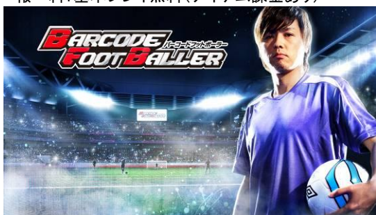
▲ 『バーコードフットボーラー』メインビジュアル