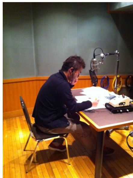
▲バーコードフットボラーの PV ナレーション 収録時の写真