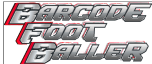
▲『バーコードフットボーラー』ロゴ