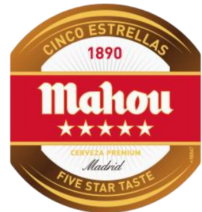
▲「Mahou コラボ記念エンブレム」