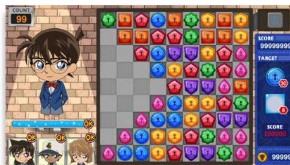
▲マイページ画面（左）、パズルステージ画面（右）