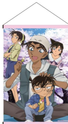
▲2種のタペストリー (イメージ画像)