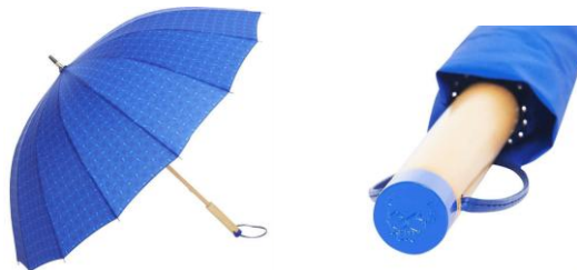
▲工藤新一モデル 和傘 (イメージ画像)

各キャラクターをモチーフにした市松デザインと、持ち手のメタルキャップにはコナンマークが付いた普段使いしやすい和傘。新一、平次、キッド、赤井、安室の全 5 種です。