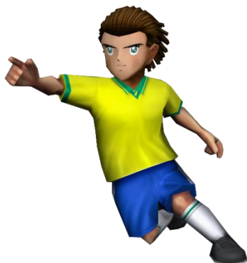
▲「★7[SP] ナトゥレーザ U18」

キャプテン翼ワールドユース編に関連した選手が獲得できる「キャプテン翼スカウト」に、新たな★7[SP]選手、「★7[SP] ナトゥレーザ U18」、「★7[SP] 日向小次郎 U18」、「★7[SP] シュナイダー U18」の 3 選手が期間限定で登場します。