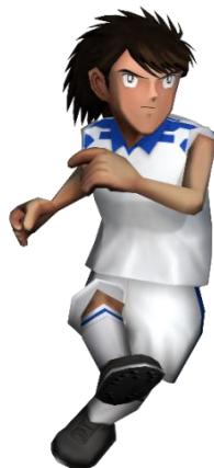
▲「★7[SP] 日向小次郎 U18」