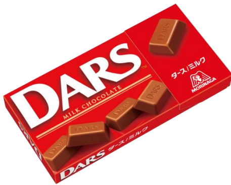
↑最もイケメンなチョコに選ばれた 「ダース<ミルク>」

株式会社サイバード（本社：東京都渋谷区、代表取締役社長：堀主知ロバート）が運営する真の“イケメン”とは何かを研究するイケメン研究所（本社：東京都渋谷区、所長：松野 智彦）は、世の中の“イケメン”に対する飽くなき探求心から、森永製菓株式会社（東京都港区芝、代表取締役社長：新井 徹）と共同で、10歳から49歳までの女性 2,054名に対し、森永製菓のチョコレート商品を対象とした「イケメンなチョコレート」に関するアンケート調査を実施しました。