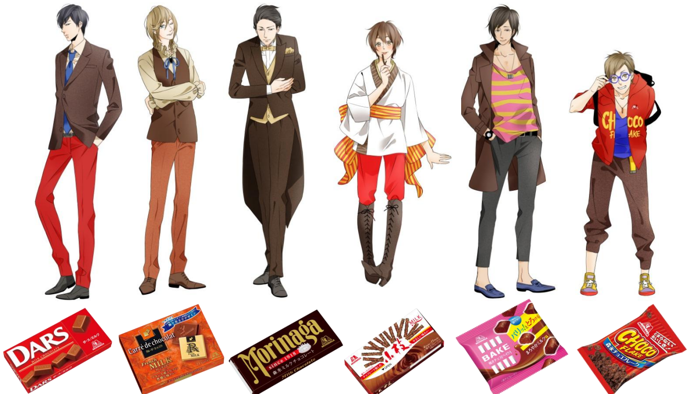
▲イラストは左から「ダース<ミルク>」、「カレド・ショコラ<フレンチミルク>」、「森永チョコレート」、「小枝<ミルク>」、「バイク<ショコラ>」、「森永チョコフレーク」