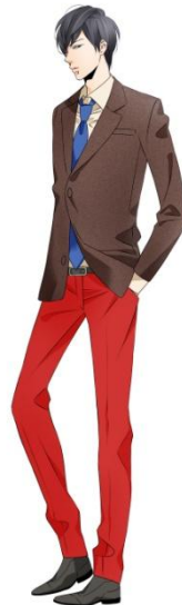
←「ダース<ミルク>」を 擬人化したイラスト イラスト/佐木 郁