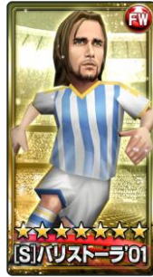
▲「[S]パリストーラ'01」選手