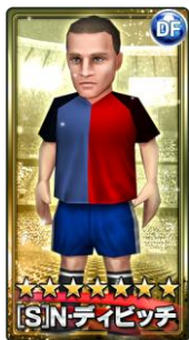
▲「[S]N・ディビッチ」選手

無料ガチャ「シルバーガチャ」に、新たに最高レアクラスの「[S]N・ディビッチ」選手が期間限定で追加されます。さらに、過去に登場した「[S]パリストーラ'01」選手、「[S]コイ・ルスタ」選手が再びシルバーガチャに登場します。