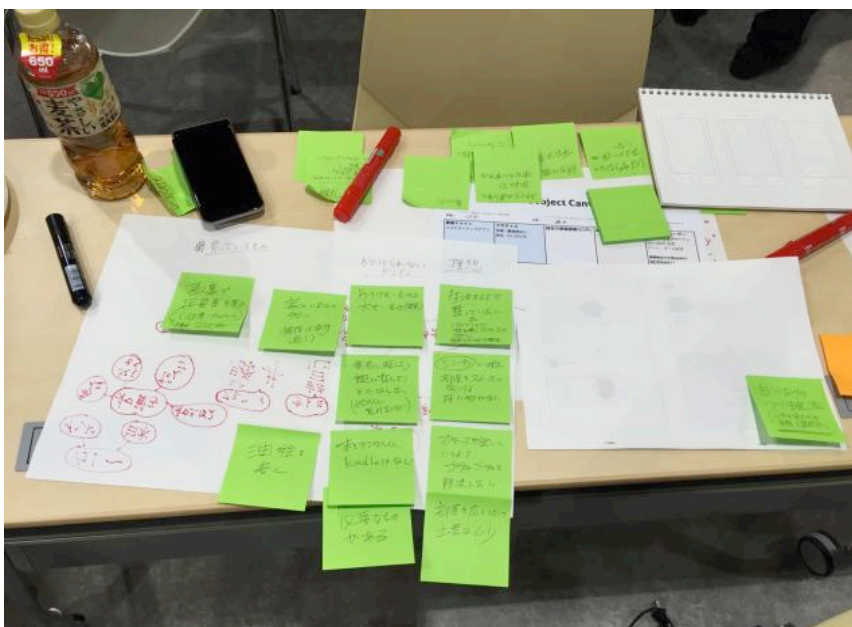
アイデアを出し合う