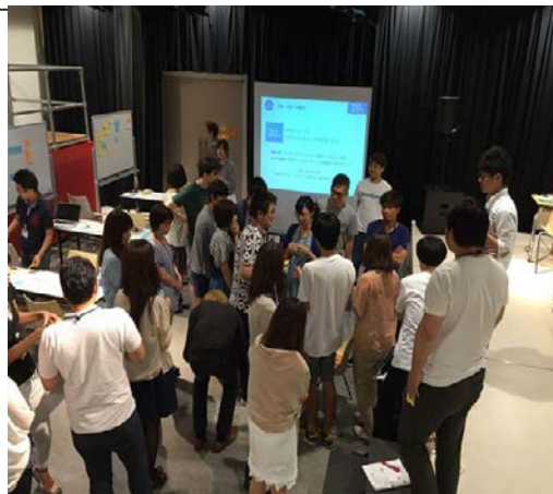
ユーザーへのインタビューの様子