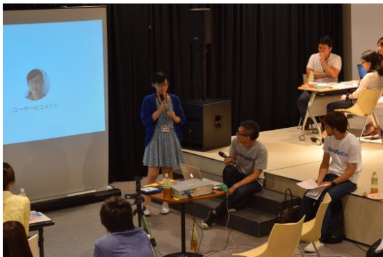
ユーザー役の社員が課題を発表