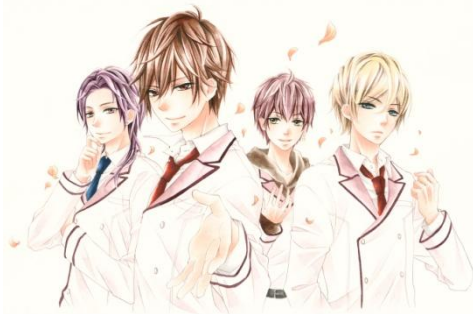
(C)梅澤麻里奈／小学館

世界中のセレブが集う全寮制の男子高校「私立ウイスタリア学園」に3カ月間の特別交流生として、転校してきた主人公灰谷真莉、高校2年生。