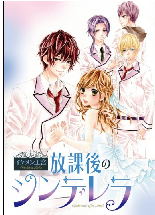
(C)梅澤麻里奈／小学館 原案／わだめ（CYBIRD）

漫画化した『イケメン王宮◆真夜中のシンデレラ』は、全世界で累計 300 万ダウンロードを誇り、華やかな王宮の世界で個性豊かなイケメンたちとの甘い恋愛ストーリーを楽しむことができる女性向け恋愛ゲームです。当社は、今回の漫画化によって、恋愛ゲームをしたことがないコミック好きといった新たな層に対し、恋愛ゲーム「イケメンシリーズ」の楽しさを訴求していきます。