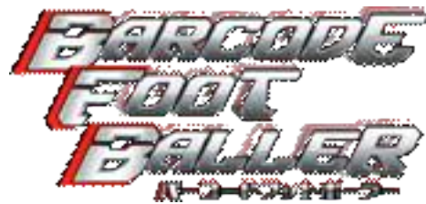
▲『バーコードフットボーラー』ロゴ