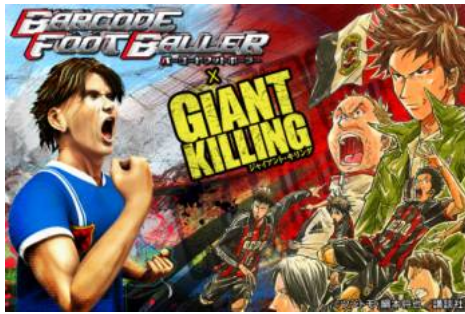
▲『バーコードフットボーラー』メインビジュアル