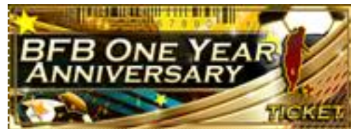
↑<1 しゅう 蹴年記念ガチャチケットイメージ画像>