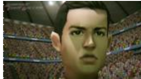
↑ <プロモーションビデオイメージ画像>