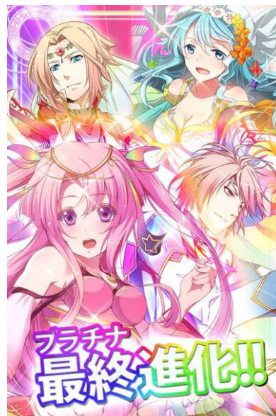
▲すべてのカードが最終進化!