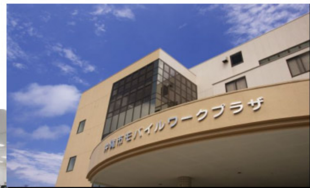
<かりゆしセンター>